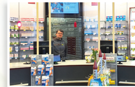
Für Ihre Sicherheit